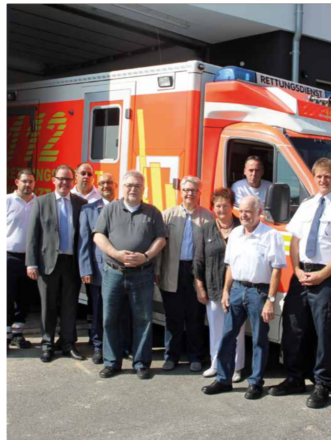
Die Krefelder Malteser nehmen im September eine neue Rettungswache in Betrieb.

Bei einer Benefiz-Matinee des Jazzvereins Aachen kommen rund 3.000 Euro zugunsten des Malteser Hospizdienstes „DaSein“ zusammen. Erstmals zeichnet die Gemeinde Grefrath engagierte Ehrenamtler aus. Preisträger ist unter anderen der Malteser Hilfsdienst.