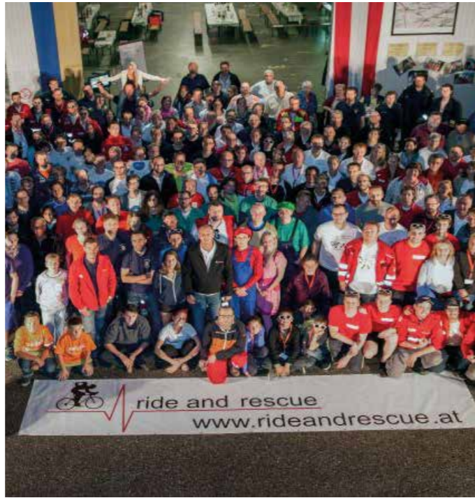
Teilnehmer des Wettbewerbs „ride and rescue“ in Österreich

Drei Teams aus Ehren- und Hauptamt der Malteser nehmen am 1. Krefelder Firmenlauf teil. Das Motto auf den Team-Shirts lautet: „Laufend im Einsatz: 365 Tage für die Menschen in Krefeld“. Den Aufbaukurs zum Betreuungsassistenten beim Malteser Hilfsdienst Monschauer Land schließen elf Teilnehmer erfolgreich ab.