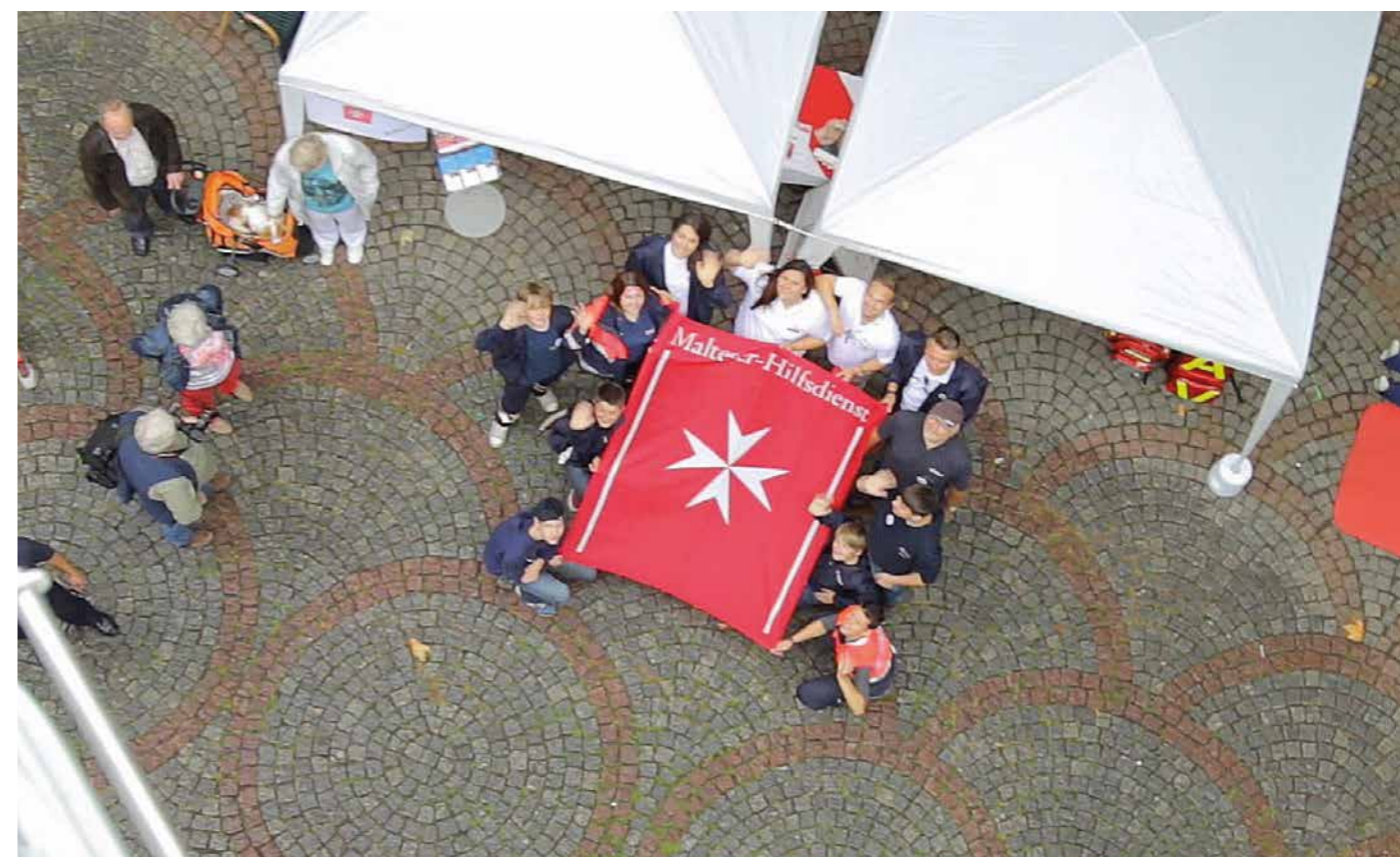
Acht Hilfsorganisationen, darunter die Malteser, stellten im Juni 2014 auf dem Kempener Buttermarkt ihre Arbeit der Öffentlichkeit erstmals gemeinsam vor.

In Aachen, Würselen, Grefrath und Kempen unterhalten wir Kleiderkammern für Bedürftige. Auch 2014 war die Nachfrage nach gut erhaltener Ware groß. Mit 275 blieb die Zahl der Kleidercontainer konstant.