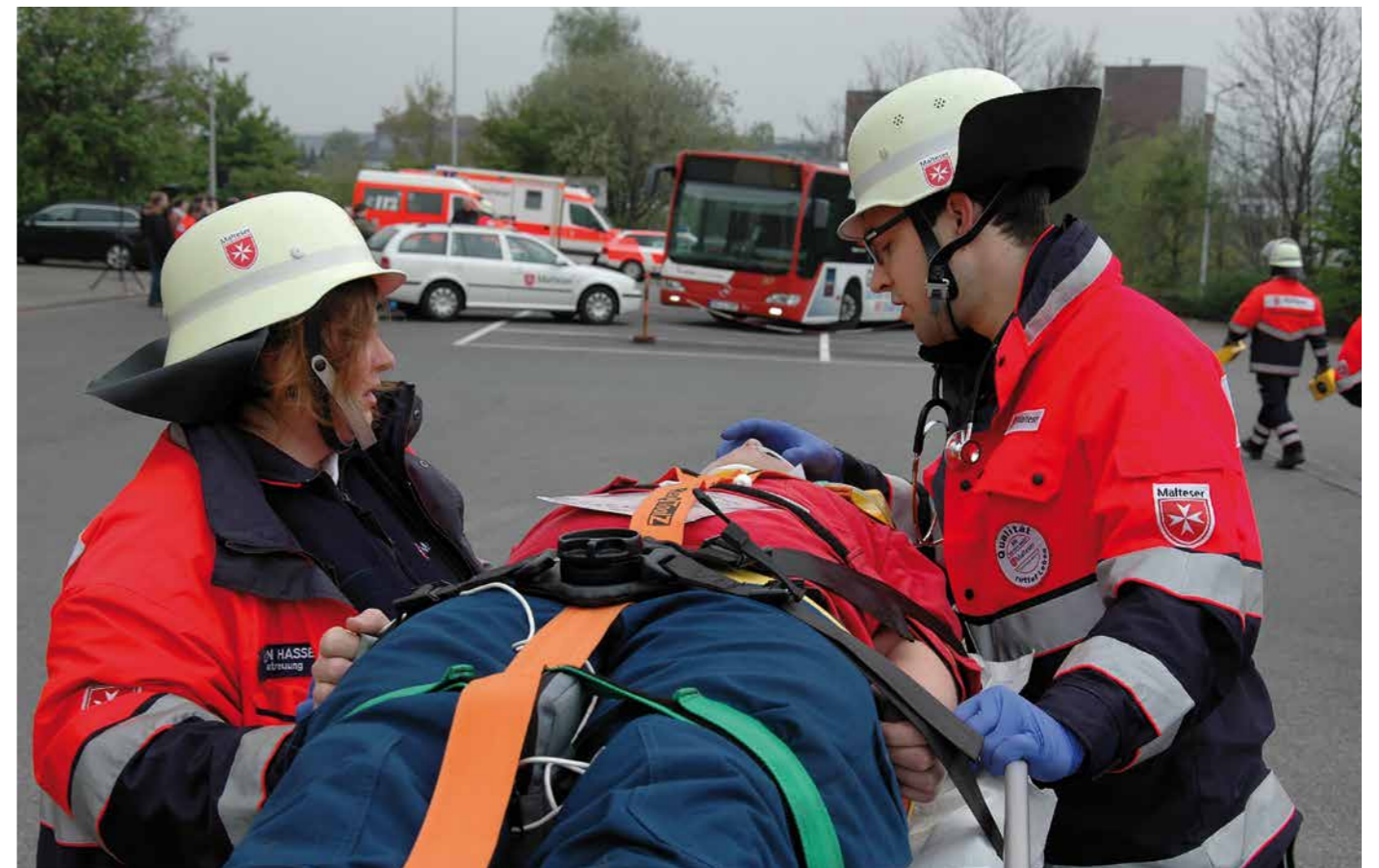
Abschlussübung der Malteser Schule Aachen für angehende Notärzte unter Beteiligung der Aachener Malteser Einsatzeinheiten am 13. April 2014 Foto: Ingo Schmitz

Herausgeber: Malteser Hilfsdienst e.V. Diözese Aachen Auf der Hüls 201, D-52068 Aachen Telefon +49 (0) 241-96 70-0 Telefax +49 (0) 241-96 70-119 E-Mail: info@malteser-aachen.de Web: www.malteser-dioezese-aachen.de Verantwortlich: Wolfgang Heidinger, Diözesangeschäftsführer Redaktion: Gerold Alzer, Pressereferent Konzept, Text: Gossen Kommunikation, Aachen Layout: Carabin Creatives Fotos: Malteser, Titelfoto: Ingo Schmitz Auflage: 1.000 Stück